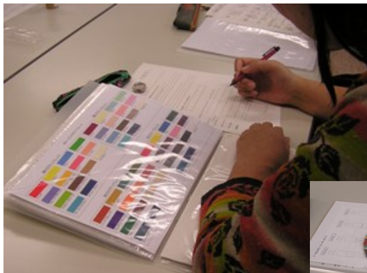
パーソナルカラー